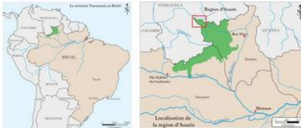
Carte 1 : localisation du territoire Yanomami et de la région d'Auaris

L'ensemble de la région est polarisée par la piste d'atterrissage installée depuis les années 1960, et agrandie et asphaltée dans les années 1980 (voir 2.), qui se situe en rive droite du fleuve Auaris, à l'endroit où la vallée de celui-ci s'élargit légèrement.