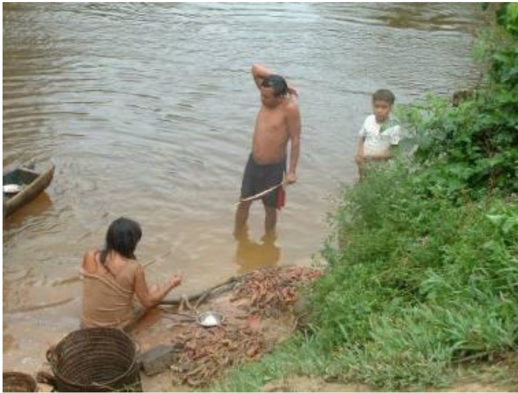
Photo 1 : préparation des vers de terre géants dans la communauté de Kolulu