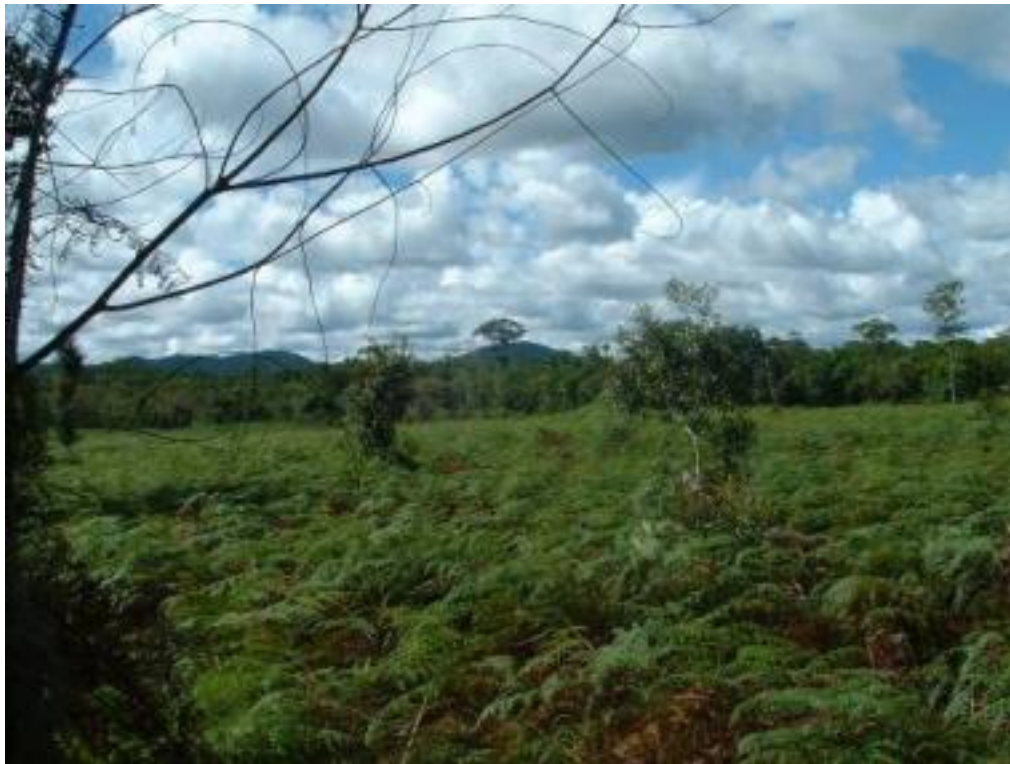
Photo 2 : anciens jardins aux sols dégradés, colonisés par des fougères